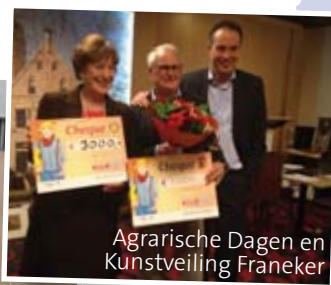
Agrarische Dagen en Kunstveiling Franeker